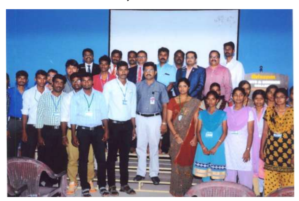
8. Inauguration of Young JCI Office Bearers