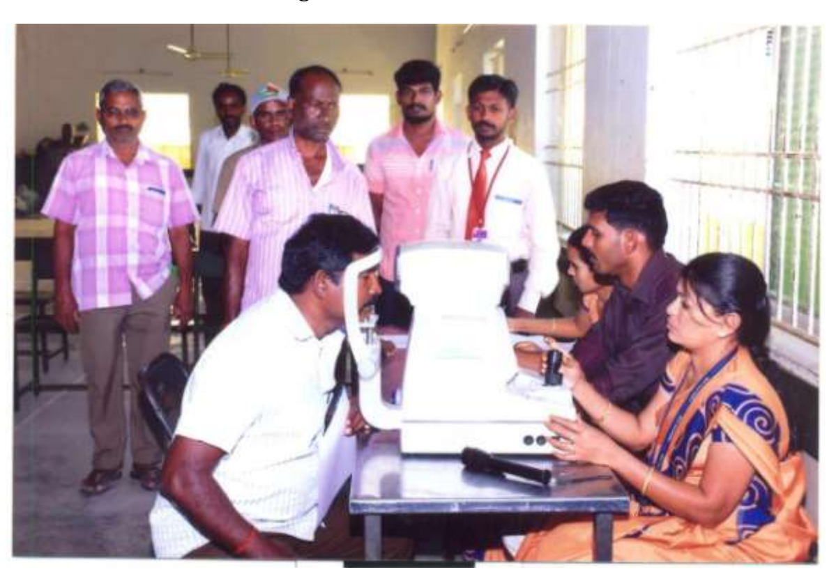
6. JCI and Vasan Eye Care Hospital, Namakkal Jointly conducted Eye Check-up Camp for drivers