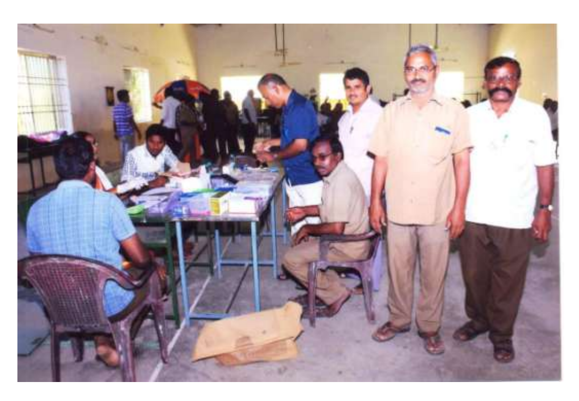
5. Health Awareness Program to Bus Drivers