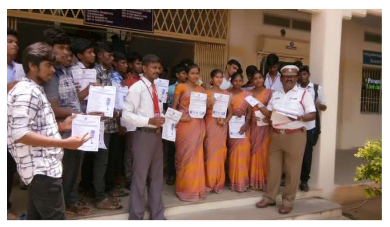
2. Helmet Awareness Program by Namakkal Traffic Police