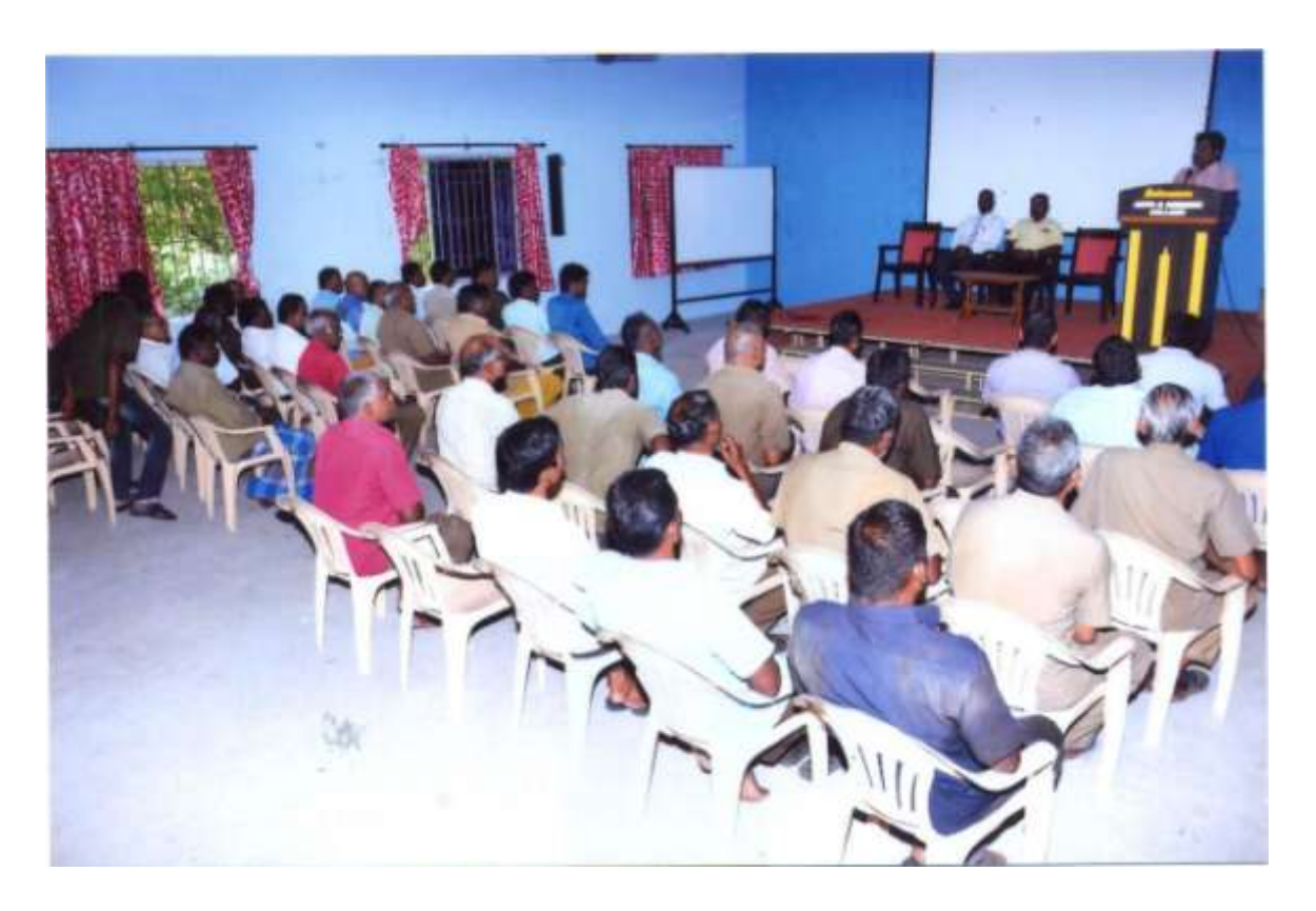
1. Drivers Awareness Program